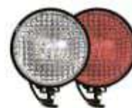
фары на СИМ